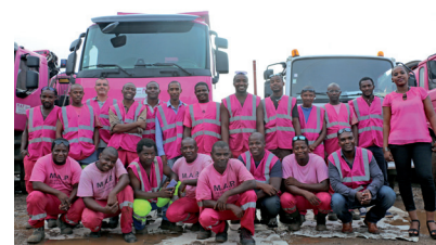
Illustration BGE Réunion PORTES OUVERTES, RENCONTRE ENTRE ENTREPRENEURS À SAINT-DENIS

Illustration BGE Guyane ATELIER RENFORCER SA STRATÉGIE COMMERCIALE, À CAYENNE